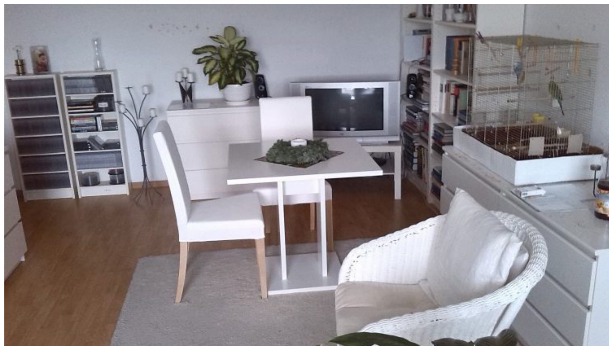
Ein Hellersdorfer Wohnzimmer aus dem Projekt "My home is my castle".

Man kann seine Randberliner Pracht also ruhig zu Schau stellen . Und wenn man an ein Schloss denkt, also an diesen repräsentativen Bau, der da in Mitte entsteht, dann ist der Gedankensprung zum Wohnzimmer nicht weit. Das sei immerhin das repräsentative Zimmer einer jeden Wohnung, so Carola. Und wenn man da hineinblickt, dann erfährt man eine ganze Menge über seine Hausherren und Besitzerinnen.