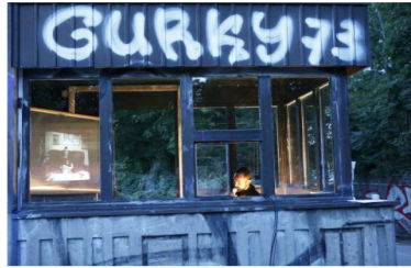
PSF 2018, CNTRM, VREMEPLOV / TIME MACHINE